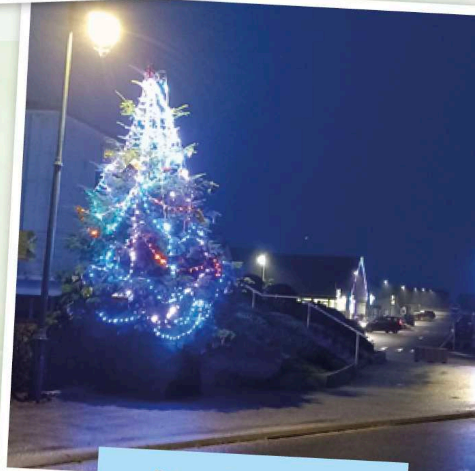
Décorations de Noël