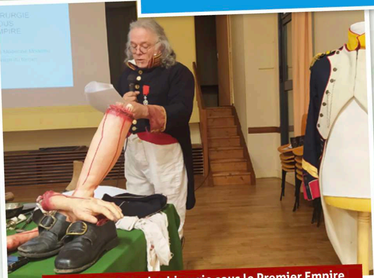
Conférence sur la chirurgie sous le Premier Empire le 27/10/2023