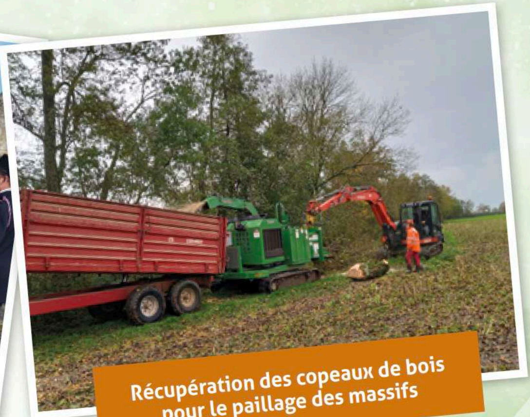
Récupération des copeaux de bois pour le paillage des massifs